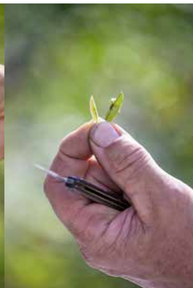
5. ELIMINAZIONE DEL LEGNO