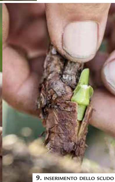
9. INSERIMENTO DELLO SCUDO