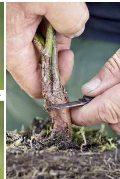
7. TAGLIO A "T" ORIZZONTALE