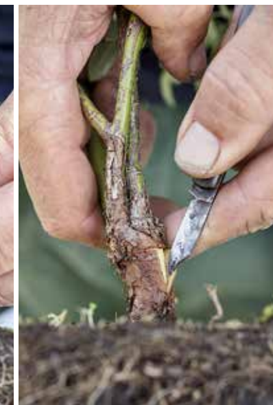
8. TAGLIO A "T" VERTICALE