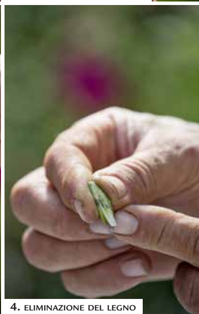
4. ELIMINAZIONE DEL LEGNO