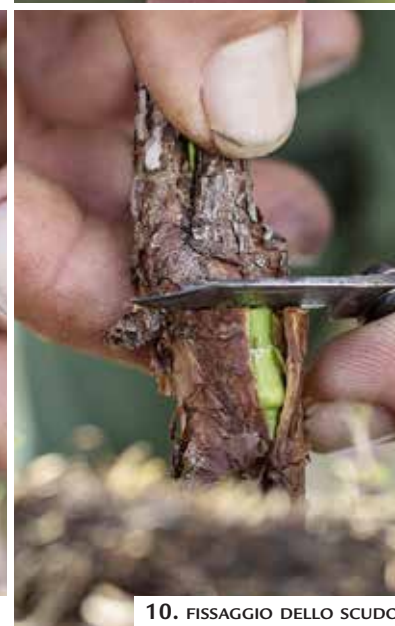
10. FISSAGGIO DELLO SCUDO