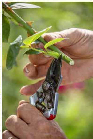
2. ELIMINAZIONE DELLE FOGLIE