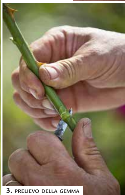
3. PRELIEVO DELLA GEMMA