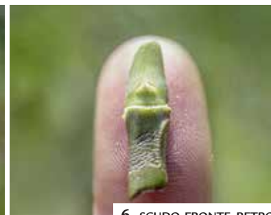
6. SCUDO FRONTE-RETRO