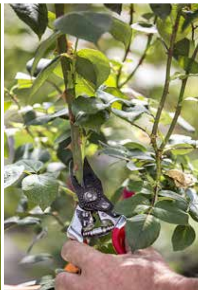
1. PRELIEVO DEL RAMO

la lama un po' di più nel passare sotto la gemma. 4-6. Eliminate il tessuto più duro e di colore chiaro (legno), in modo da mettere a nudo lo strato di cellule (cambio) che permetteranno la saldatura dell'innesto. 7 e 8. Effettuate un taglio a T nella corteccia del portinnesto, a circa una spanna da terra: il punto di innesto, infatti, deve sempre trovarsi fuori terra per evitare di predisporre la pianta all'attacco di funghi patogeni. 9-10. Scollate delicatamente la corteccia e fatevi scivolare dentro lo scudetto. 11. Legate l'innesto con l'apposito nastro di gomma. 12. La primavera successiva, eliminate tutta la vegetazione del portinnesto e accorciate il germoglio che nel frattempo si sarà sviluppato dalla gemma innestata.